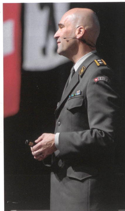
Der Chef FUB, Div Süssli, nannte die Leistungen 2018 der Brigade sehr gut.