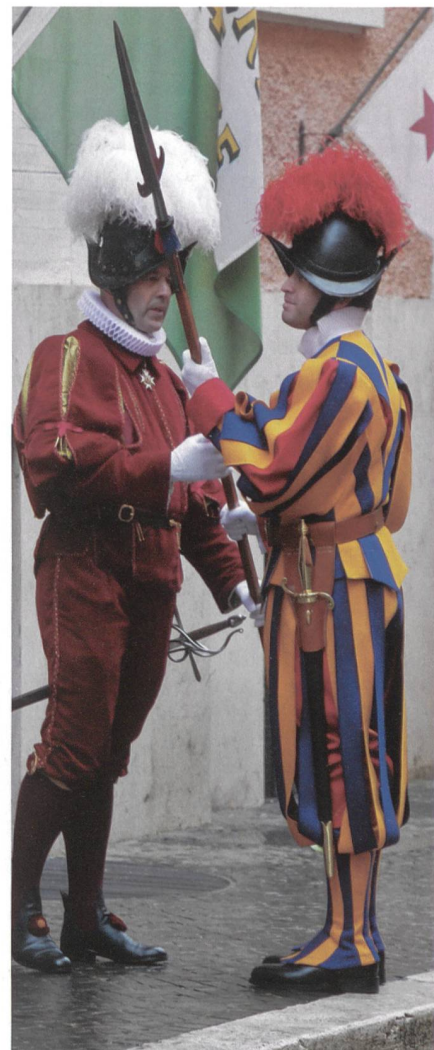
Der Kdt, Oberst Graf, überreicht einem vom Vize-Korporal zum Korporal beförderten Unteroffizier die Lanze.