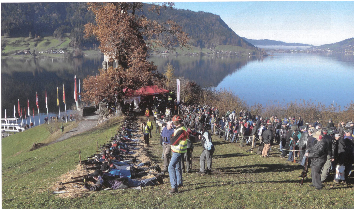
Traditionsreiches, anspruchsvolles Gewehrschiessen beim Heldendenkmal über dem Aegerisee.