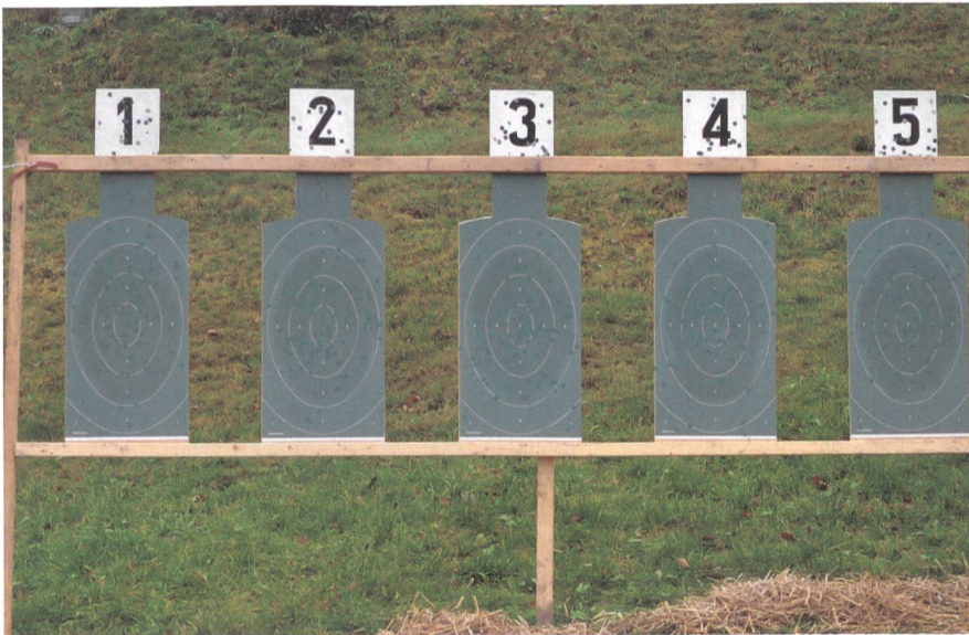
Selektioniert jedes Jahr die Pistolenschützen: Die 50-m-Morgartenscheibe.