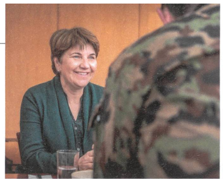
Bundesrätin Amherd: Guter Eindruck.

Das Besuchsprogramm führte auch in eine Stellung der Fliegerabwehr.