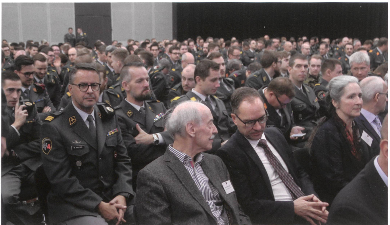
950 Aktive der Ter Div 4 nahmen in St. Gallen, dem Standort des Verbandes, am Jahresrapport teil.

Laut dem Chef des MND, Brigadier Alain Vuitel, gilt es, mehrere Herausforderungen im Auge zu behalten. Er nannte Spionage, Cyber oder Terror. Die Schweiz sei zwar kein primäres Ziel für Terror, aber Teil der westlichen Welt. Gleichzeitig ist unser Land in hohem Masse abhängig von Kriti-