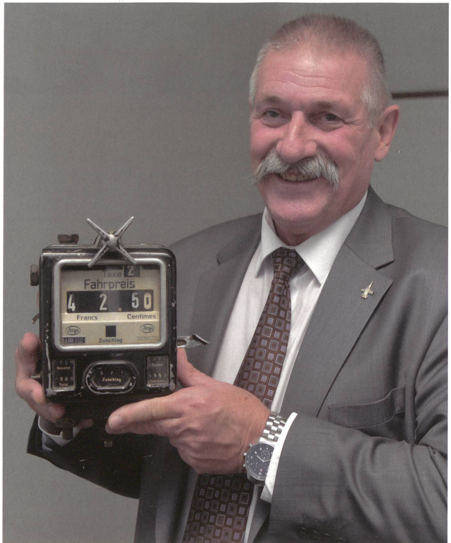
Der Taxi-Profi Casa mit einem Relikt aus vergangenen Zeiten – Fahrpreis Fr. 2.50!

Er habe tausende Ereignisse in all den Jahren erlebt, verriet er und wies schmunzelnd auf den Einsatz im WK 2003 hin, als seine Soldaten in der Stadtkaserne Frauenfeld bei den Dreharbeiten zum Film «Ach-