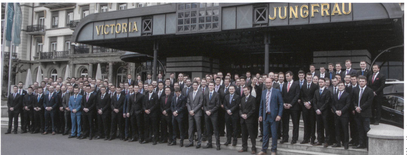
Auch schon bot das Hotel Victoria Jungfrau in Interlaken die würdige Kulisse für die jährliche Zusammenkunft.