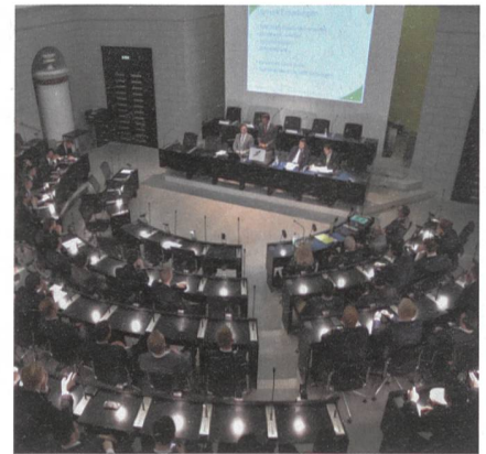
GV in würdigem, festlichem Rahmen.

Bereits jetzt schon mit Spannung erwartet wird, wo das Treffen 2020 stattfin-