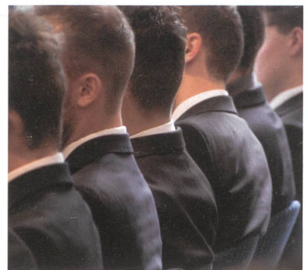
Mitglieder von EXEMPLO DUCEMUS!

det. Die Jahrestreffen werden jeweils durch ein freiwilliges Organisationskomitee durchgeführt. Ein Traktandum wird die Wahl des OK 2021 sein – Freiwillige vor.