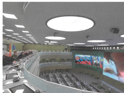
26. Dez. 2018: Putin erteilt Startbefehl, mit Generälen Shoigu und Gerassimow.