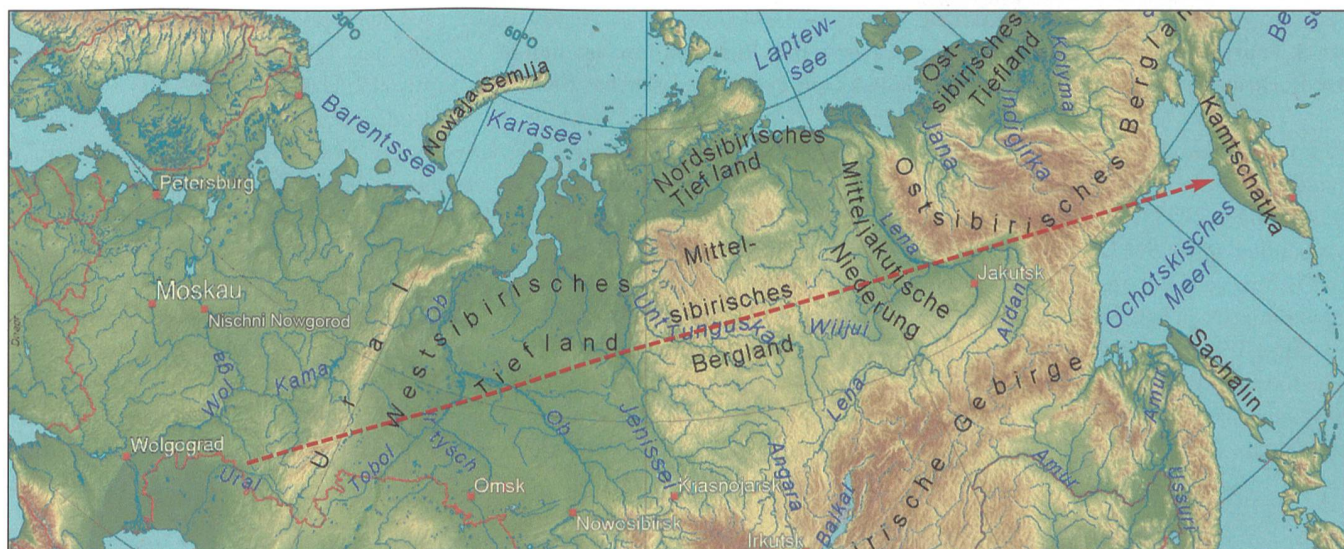
Die Avangard-Flugbahn führte über 6000 Kilometer von Orenburg an der kasachischen Grenze nach Kamtschatka am Pazifik.