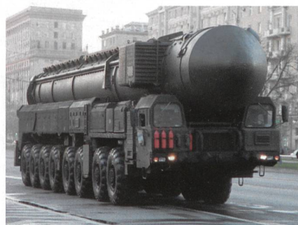
Raketensystem in der Stadt Moskau.