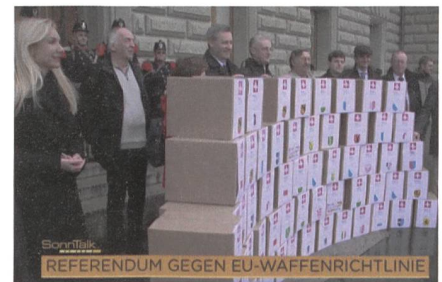
Als positiv wurde die Medienpräsenz im Tele Züri eingestuft.