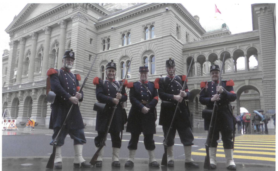
Die Ehrenwache der Cp 1861 in ihren würdigen Uniformen vor dem Bundeshaus.