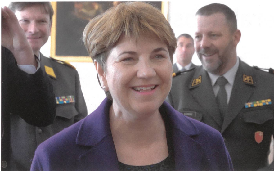
Bundesrätin Viola Amherd zu Gast bei der SOG im Kloster Einsiedeln.

Aus dem Kloster Einsiedeln berichtet Chefredaktor Peter Forster, Delegierter der KOG Thurgau