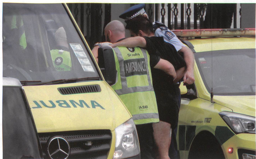
Ein Sanitäter und ein Polizist bringen einen Verwundeten zum Krankenwagen.