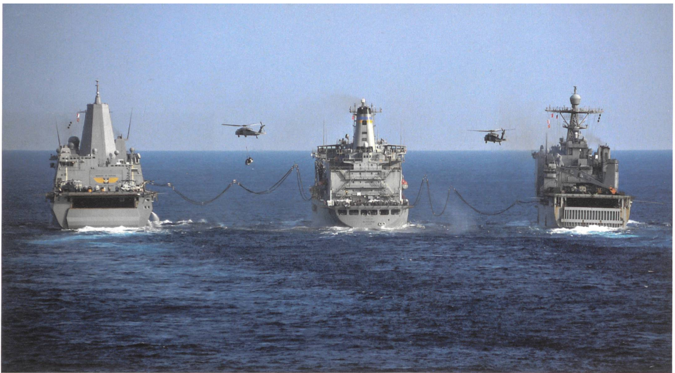
Philippinisches Meer: USS Green Bay, USNS Walter S. Diehl und USS Ashland werden von MH-60S-Seahawk-Heli versorgt.

leisten, als Paradebeispiel. Dort funktioniert die totale Überwachung. Hunderttausende von Uiguren sollen in « Umerziehungslagern » ohne Gerichtsurteil eingesperrt sein. Die Provinz Xinjiang dient als Blaupause für das gesamte China.