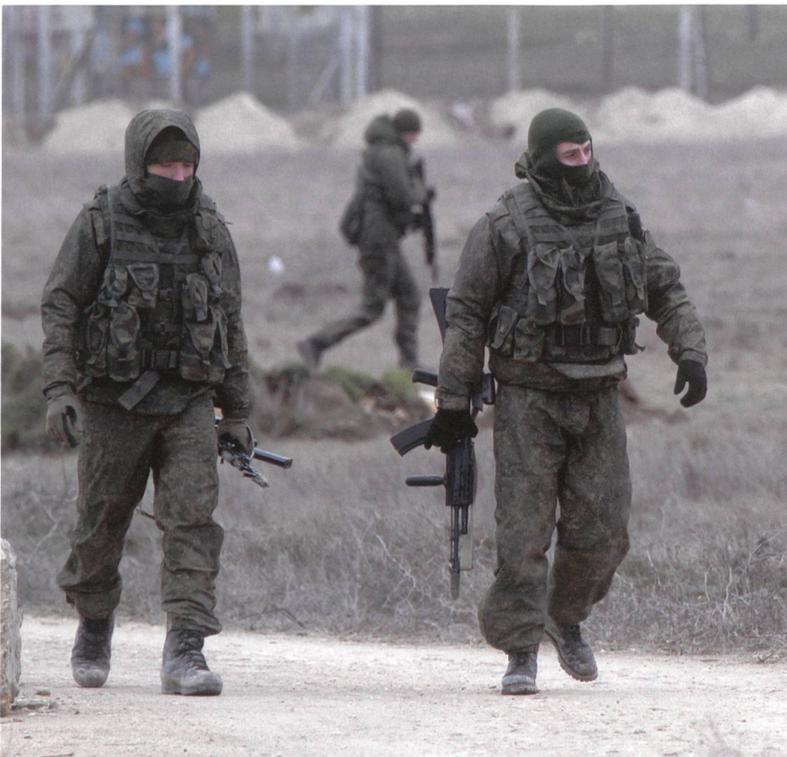
2014: Besetzung der Krim. Die «kleinen grünen Männchen» waren Elitetruppen.

Wenn man auf einer Weltkarte Autokratien und Demokratien auf der Zeitachse der letzten 50 Jahre farblich kennzeichnen würde, würde man den Vormarsch der Autokratien deutlich erkennen. Allerdings gibt es unter den 50 gescheiterten Staaten viele Autokratien, die zu den Verlierern zählen. «Erfolgreiche» Autokratien weisen ge-