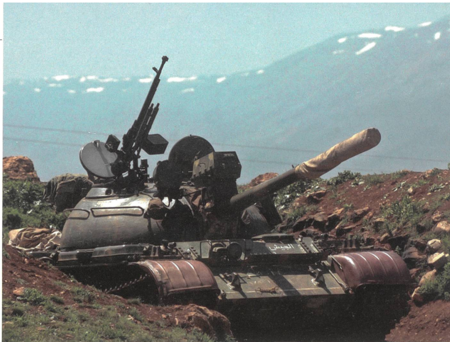
Syrien: T-55 am Fuss des Hermon. Grün, die Schutzbleche braun. Die Mündungsbremse vorne kennzeichnet den T-55 (ein weiteres Merkmal wäre das Fahrwerk).

In allen israelischen Brigade- und Bataillonsstäben dienten Nachrichtenoffiziere, deren Familien aus arabischen Ländern