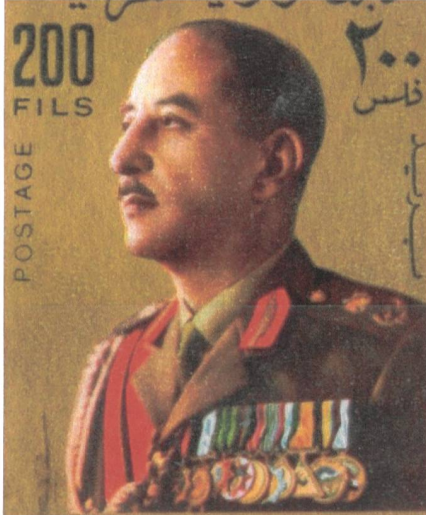
Iraks Präsident und General al-Bakr (historisches Bild auf Briefmarke).

kische Angriffsspitze war eingeschlossen und dem Untergang geweiht.