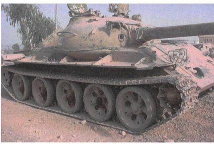
Irak: T-62, sandfarben gestrichen wie alle irakischen Tanks gegen Israel.