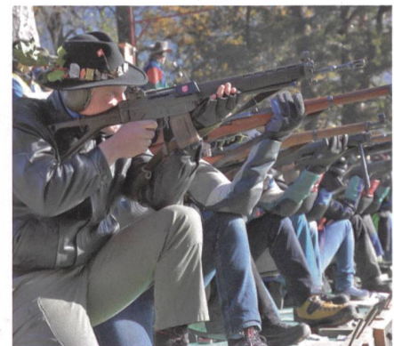
Schweizer Schützentraktion: Rütli-schiessen am Mittwoch vor Martini.

Man stelle sich vor, die Situation in Venezuela mit der Unzufriedenheit des