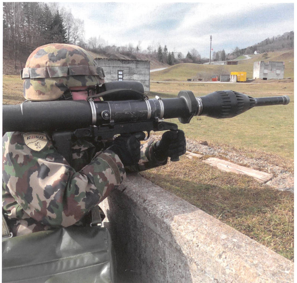
Der Walliser zielt auf dem St. Galler Breitfeld.