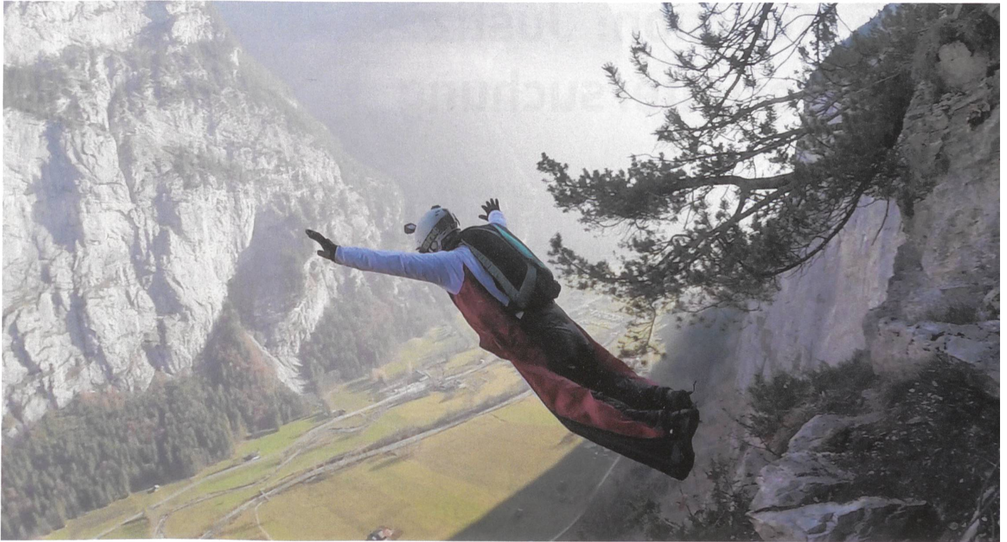
Freizeit in den Alpen hoch über dem Tal.