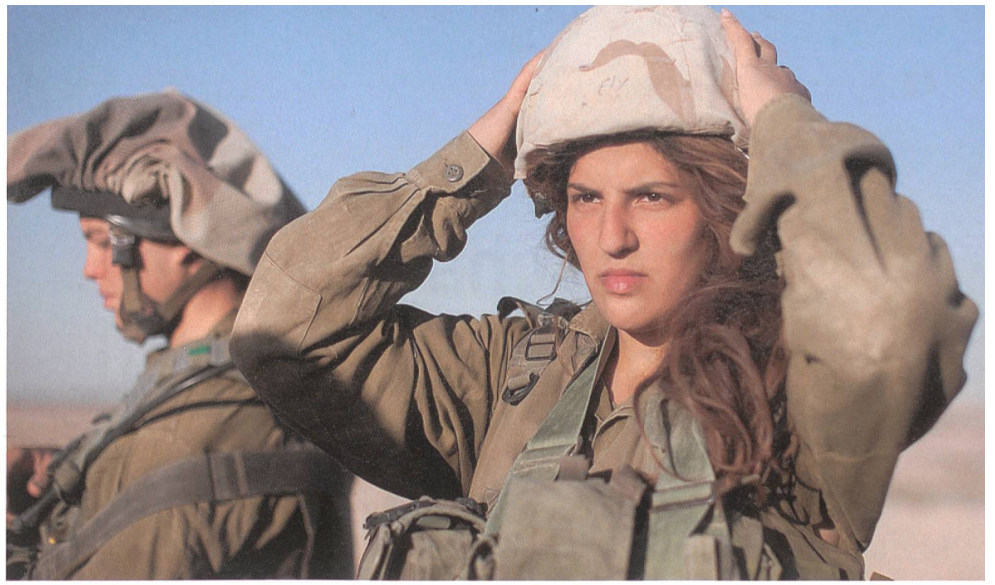
Im israelischen Caracal-Bataillon erfüllen Frauen im Negev Kampfaufträge.