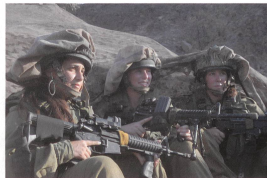
Aufklärung an der Nordfront. Seit dem Jahr 2000 stehen in Israel sämtliche Funktionen Frauen und Männern offen.