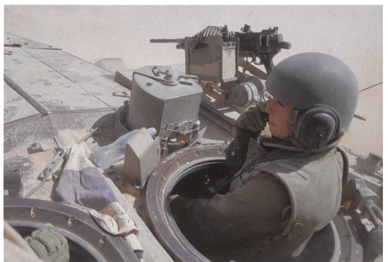
Israel: Panzerkommandant führt Merkava-Tank ins Gefecht.