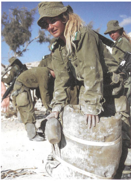
Israel: Wüstenmarsch der Infanterie.