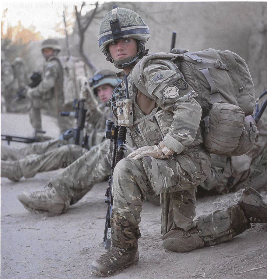
Britische Afghanistan-Truppen im Krieg in der hart umkämpften Provinz Helmand.