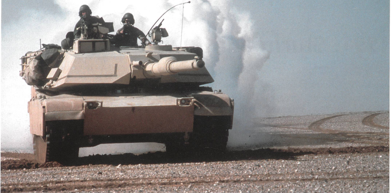
Panzer M1A1 Abrams, VII Korps, 3. Panzerdivision, Vormarsch Richtung Al Bucayyah.

Kuwait selber oder verteidigte die irakische Grenze zu Saudi-Arabien.