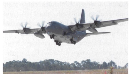
Neue Block 30-Variante des AC-130J-Gunships.

Die 4th Special Operations Squadron hat als erste Einheit der US Air Force die neueste Ausführung der Lockheed Martin AC-130J in Empfang genommen. Äusserlich