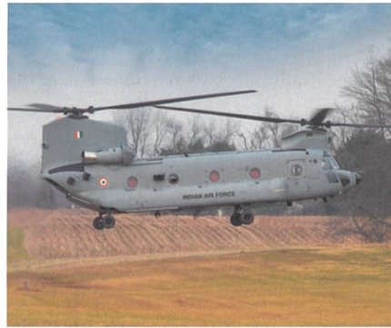
Indienststellung der ersten indischen CH-47F(I) Chinook.

Die indische Luftwaffe (IAF) hat Ende März ihre ersten vier von 15 Boeing CH-47F(I) Chinook offiziell in Dienst gestellt. Die vier Helikopter waren per Schiff schon Mitte Februar im Hafen Mundra in Gujarat eingetroffen. Die Chinooks sollen in den nördlichen und östlichen Regionen In-