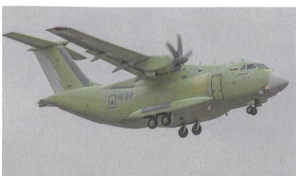
Jungfernflug des neuen russischen Transportflugzeugs Il-112W.

Dem Erstflug der Il-112W ging ein umfangreiches Bodentestprogramm voraus, bei dem alle Systeme überprüft wurden. Zuletzt gab es Hochgeschwindigkeits-Rollversuche, bei der die Maschine auch