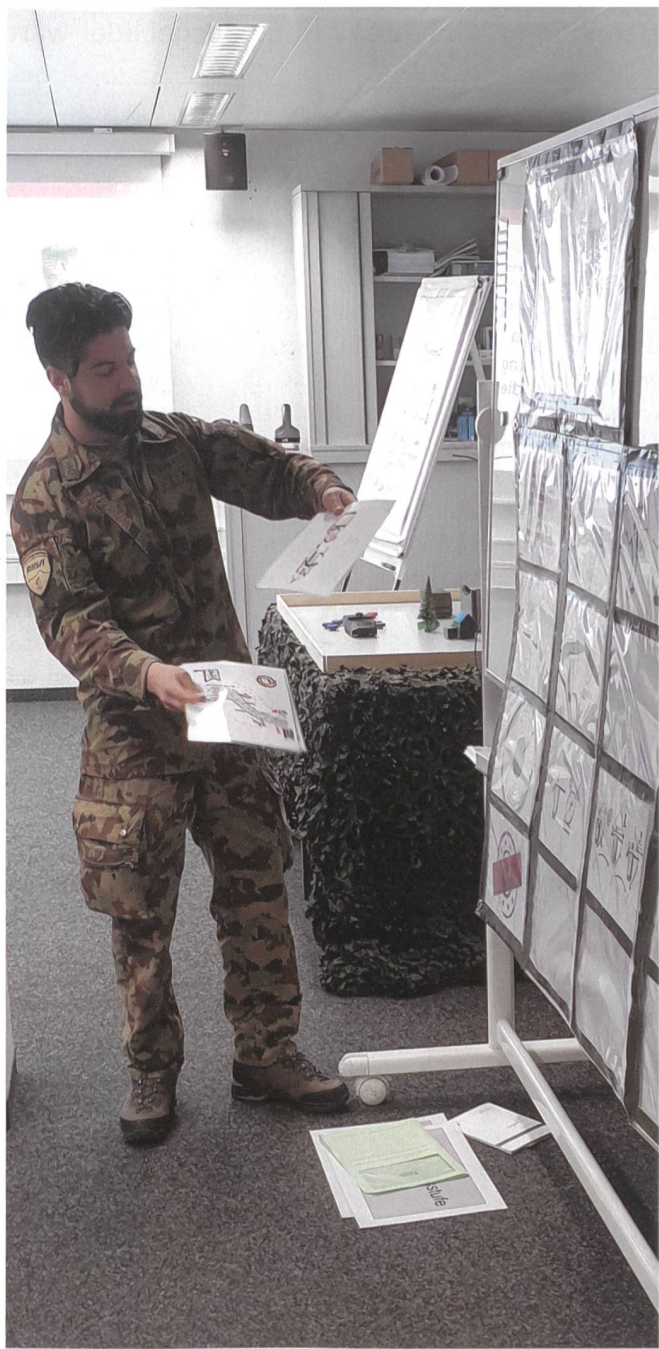
Präsentation der selbst erstellten Hilfsmittel.