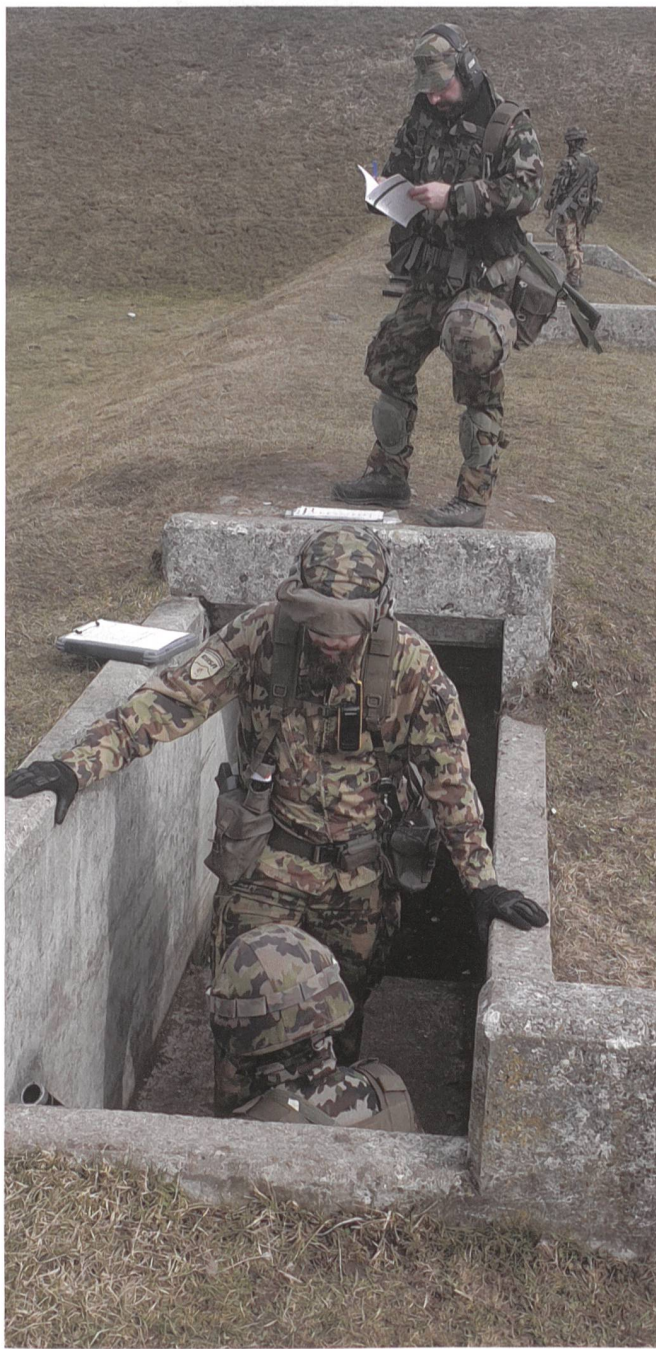
Rolle als Zugführer während einer Feldtag-Ausbildung.