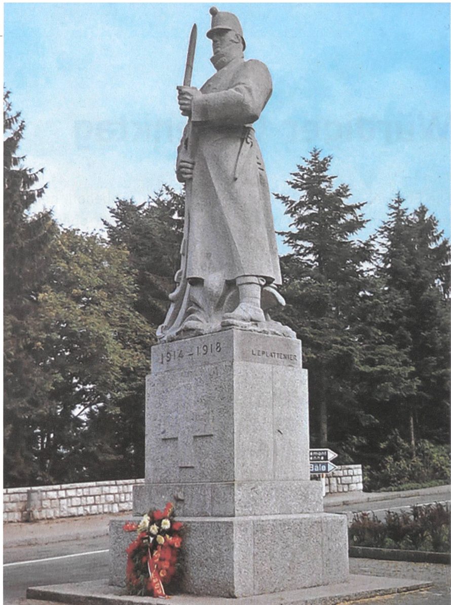
Der steinerne Fritz erinnerte an die Grenzbesetzung 1914–1918, bis ihn die Gruppe Béliér in vandalischem Verbrechen vom Sockel riss. Ihre Vandalenakte trugen der Gruppe quasi in der ganzen Schweiz Ablehnung und Missbilligung ein. Später zertrümmerten sie den Kopf des Soldaten und sein Bajonett.