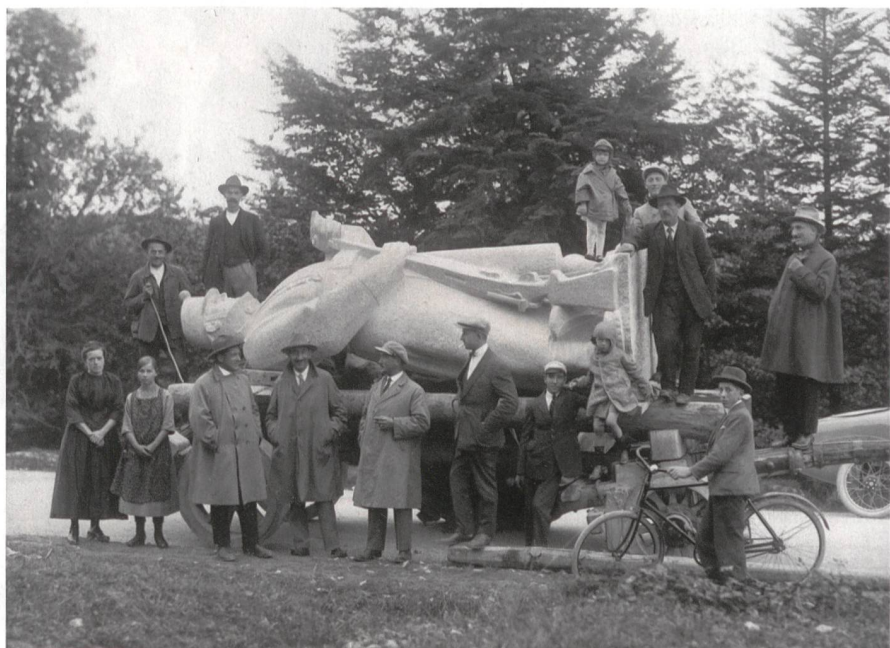
1924: Der Transport des steinernen Wachtsoldaten des Bildhauers l'Éplatténier.