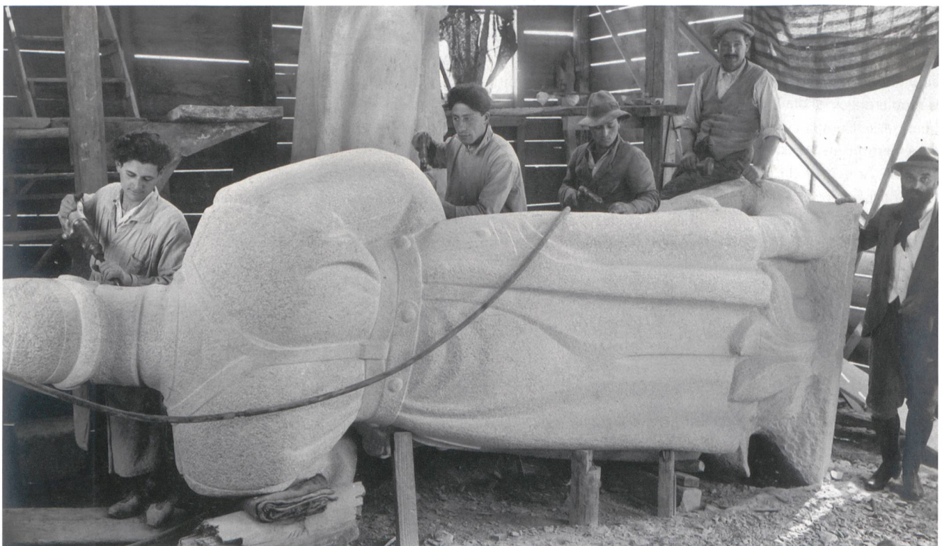
1924: Das Soldatendenkmal für den Col des Rangiers erhält in der Werkstatt den letzten Schliff.

In den 1980er-Jahren radikalisierten die Béliers ihre Aktionen und verwüsteten