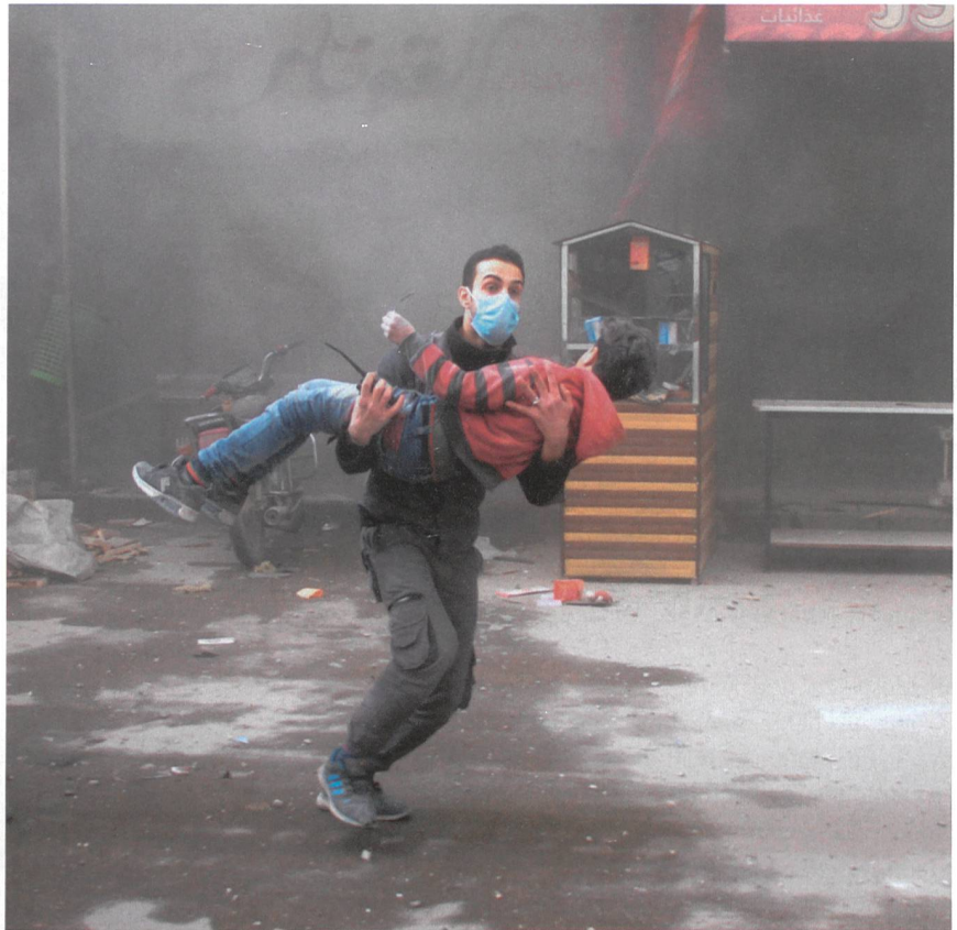
Endkampf auch in Idlib: Ein ziviler Helfer birgt einen Jungen aus dem Schussfeld.

Von Anfang an war klar, dass dies ein Schutz auf Zeit war. Offenbar nehmen sich das Asad-Regime, Russland und Iran die «Freiheit», den letzten Rebellenkessel noch ganz aufzubrechen. Peter Forster