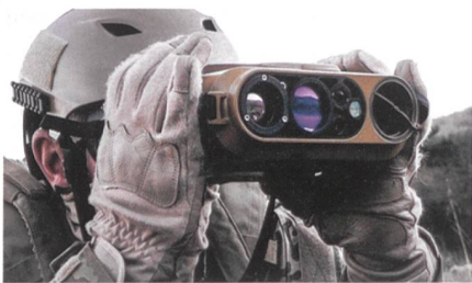
JIM Compact von Safran.

Auf dem Special Operation Forces Innovation Network Seminar SOFINS 2019 stellte Safran Electronics & Defense die neue Version seines multifunktionalen Infrarot-Fernglases JIM Compact (JIMC) mit einer «Long Range Sniper» (TELD) Funktion vor. Die TELD-Funktion verbessert die operativen Fähigkeit des Scharfschützen indem die Ersttrefferwahrscheinlichkeit auf bewegliche Ziele signifikant erhöht wird. Die neueste Generation des JIM Compact wiegt weniger als 2 kg (mit Batterie)