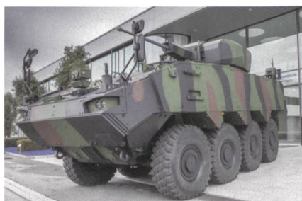
Erfolgreiche Schiesstests für rumänische Piranha 5.

General Dynamics European Land Systems (GDELS) hat mit dem erfolgreichen Abschluss von dynamischen Schiesstest in Anwesenheit der rumänischen Beschaffungsbehörde einen wichtigen Meilenstein im PIRANHA 5 Programm für die rumänische Armee erreicht. Ein voll ausgerüsteter PIRANHA 5 führte eine Reihe von statischen und dynamischen Schiessversuchen