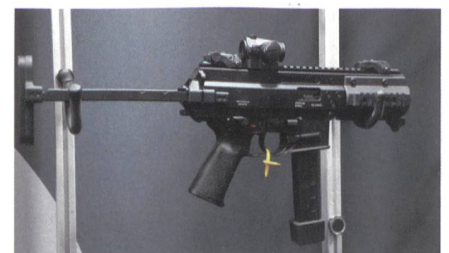
Kompakt-MP B&T 9K-SD für die Army.

Die U.S. Army hat den Schweizer Waffenproduzenten B&T mit der Lieferung von 350 Maschinenpistolensystemen «Sub Compact Weapon» (SCW) beauftragt. Überdies besteht eine Option für eine weitere Beschaffung von bis zu 1000 SCWs. Bei dem ausgewählten Modell handelt es sich um den B&T APC PRO K im Kaliber 9mm x 19. Zum Lieferumfang gehören neben den Waffen, Tragegurte, Handbücher,