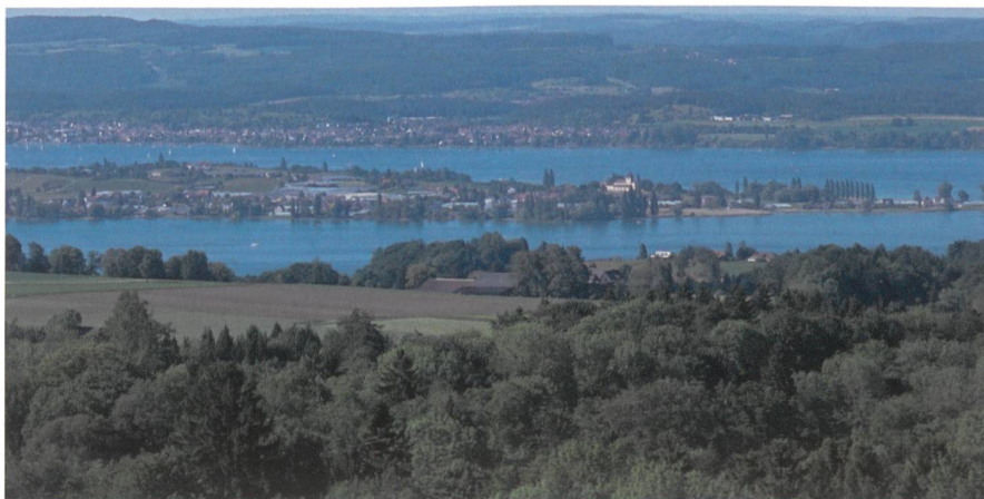
Blick von Hohenrain auf die Reichenau.