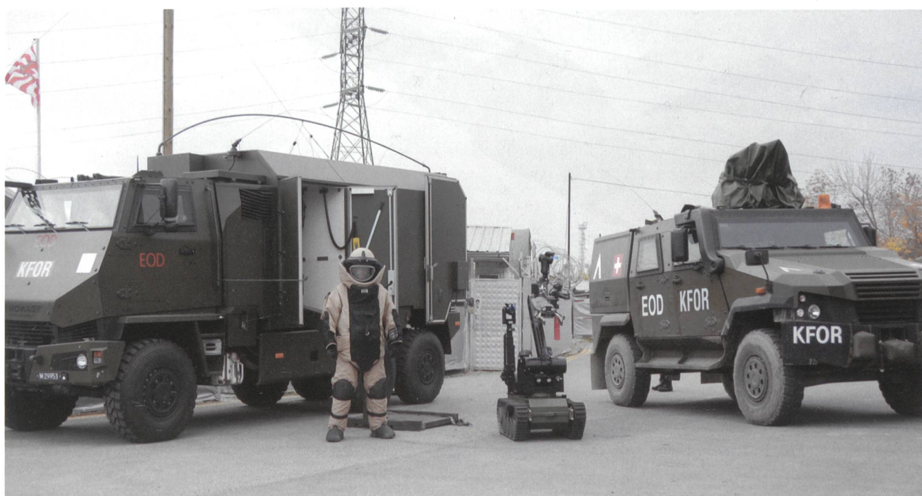
Unter die Haut ging das Bild vom Plus-40-Kilogramm-Mann, der vor einem anspruchsvollen, kritischen Einsatz den schweren Schutzanzug trägt. Zu erkennen sind auch der Duro III P, der Eagle IV und eine Fernlenkplattform.