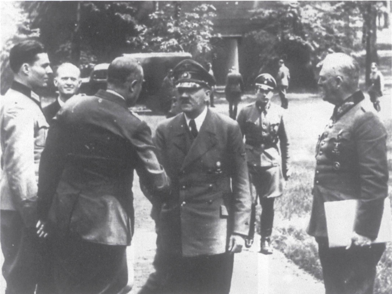
15. Juli 1944, Wolfsschanze: Oberst Graf Stauffenberg, Generaloberst Fromm, Adolf Hitler, Generalfeldmarschall Keitel.