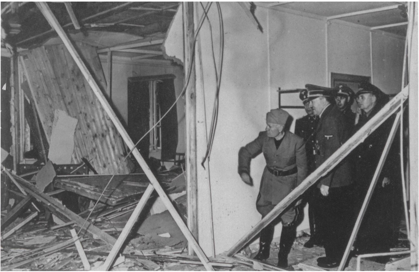
20. Juli 1944, am Nachmittag: Benito Mussolini, der «Duce», und Adolf Hitler, der «Führer», in der zerstörten Lagebaracke der Wolfsschanze. Als die Bombe explodierte, befanden sich Hitler und 23 Offiziere im Kartenraum. Die Sprengladung tötete vier Männer, alle vom Holzsockel nicht geschützt. Neun Rapportteilnehmer wurden schwer verletzt, die übrigen leicht.