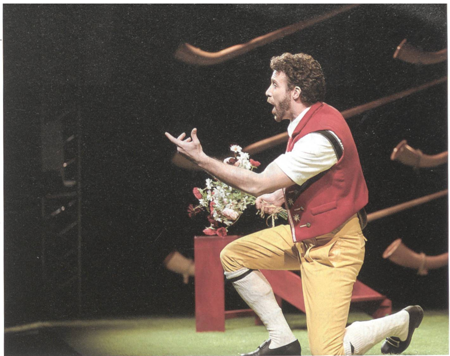
Die Oper Betsy im Reppischtal.

Feldweibel Max, Betlys Bruder, erkennt die verfahrenere Lage und verbündet sich mit dem Verliebten Daniel. Er will seiner Schwester eine Lektion erteilen. Da er sie schon seit 15 Jahren nicht mehr gesehen hat, gelingt ein glückliches Zusammentreffen, und Daniel und Betly finden zueinander. Mit den Kameraden und den Dorfbewohnern wird gefeiert. ■