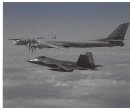
F-22 Raptor fängt Tu-95 ab.

Am Montag, den 20. Mai 2019, konnten US-amerikanische F-22 Raptor Abfangjäger vier Langstreckenbomber des Typs Tu-95 Bear Bomber über neutralen Gewässern vor Alaska abfangen. Die vier Tu-95 Bomber befanden sich laut russischen Angaben auf einem routinemässigen Patrouillenflug über internationalen Gewässern vor Alaska. Die vier grossen Turboprop-Bomber wurden von zwei Su-35 Kampffjets begleitet. Die Bear Bomber waren länger als 12 Stunden in der Luft, solche Langstreckenflüge gehören zur Routineaufgabe der russischen Bomberbesatzungen.