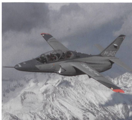
Trainingsflugzeuge M-345 für Italien.

Die neuen Flugzeuge, von denen das erste voraussichtlich 2020 ausgeliefert wird, werden die Flotte der 18 zweistrahligen Aermacchi M-346 (T-346A) ergänzen,