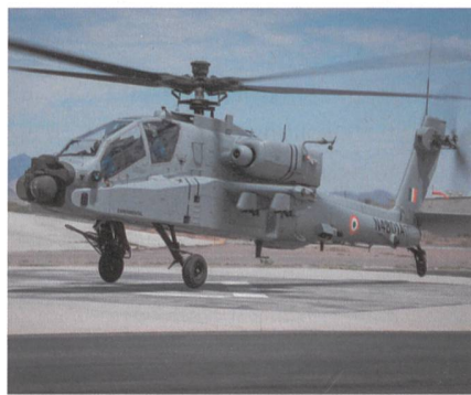
AH-64E (I) für Indien.

Indien konnte im Mai seinen ersten AH-64E (I) Apache übernehmen, die ersten Kampfhelikopter dieses Typs werden im Juli nach Indien überführt. Der erste von 22 bestellten AH-64E (I) Apache wurde im Boeing Werk in Mesa feierlich an die indischen Luftstreitkräfte übergeben. Die ersten Helikopterbesatzungen und das zugehörige Bodenpersonal wurden bei der US Army in Fort Rucker, Alabama, ausgebil-