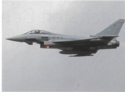
Ein intakter Bundeswehr-Eurofighter.

Die abgestürzten Maschinen gehören zum Taktischen Luftwaffengeschwader 73 «Steinhoff», das in Laage bei Rostock stationiert ist. Der Jet ist 15,9 Meter lang und