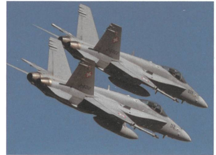
Zwei F/A-18 der Luftwaffe. Es handelt sich nicht um die Jets, die in den Vorfall über Altendorf involviert waren.

SZ unterwegs. In ihm sassen zwei Schweizer. Die beiden Jets der Luftwaffe befanden sich in einem Verbandsflug. Ihr Start-