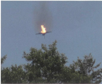
24. Juni 2019, um 14 Uhr: Jet-Absturz über Mecklenburg-Vorpommern.

Eines der beiden Flugzeuge war in Schwerin nahe der Ortschaft Jabel in ein Waldstück abgestürzt. Das andere sei südlich der Ortschaft Nossentiner Hütte an ei-