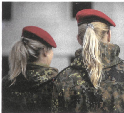
Bundeswehr: Frauen mit langen Haaren.

Das Bundesverwaltungsgericht wies den Antrag ab, weil «die Gleichberechtigung unterschiedliche Regelungen für Soldatinnen und Soldaten» nicht ausschliesse. Dafür brauche es eine «hinreichend bestimmte gesetzliche Grundlage.» Das Verteidigungsministerium kündigte an, diese Grundlage nun schnell zu schaffen. Vor allem müssen militärische Belange berücksichtigt werden. loy.