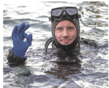
Militärtaucher im schweren Einsatz.