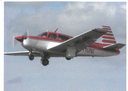
Themenbild vom Leichtflugzeug Mooney M20J. Beim Fast-Zusammenstoss war ein solches ziviles Flugzeug beteiligt.

Das Leichtflugzeug Mooney M20J der Fluggemeinschaft Wangen war vom bayrischen Memmingen aus auf dem Weg zum Heim-Flugplatz Es handelte sich um einen Schulungsflug. An Bord waren ein 68-jähriger Fluglehrer sowie sein 56-jähri-