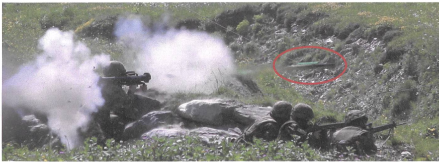
Wichlen: Das Ostschweizer Inf Bat 61 trainiert im scharfen Schuss – Seiten 18-19.