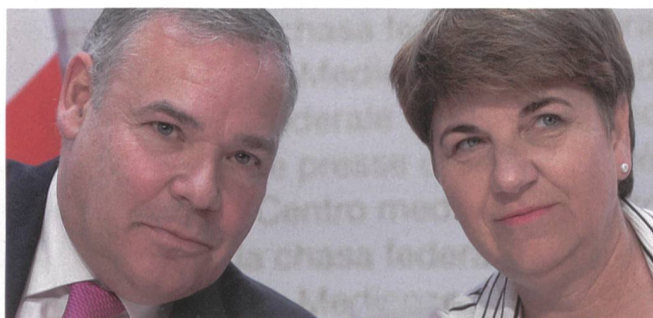
Gaudin mit der Chefin, Bundesrätin Amherd. Viola Amherd und Jean-Philippe Gaudin waren im Bundesrat erfolgreich.