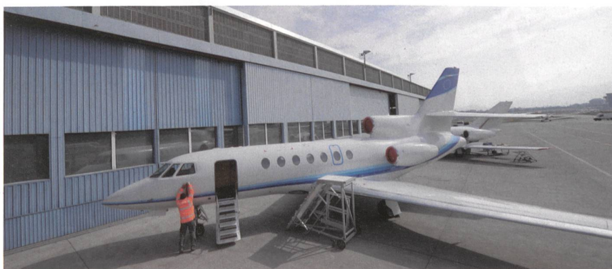
Der Standort Genf-Cointrin.