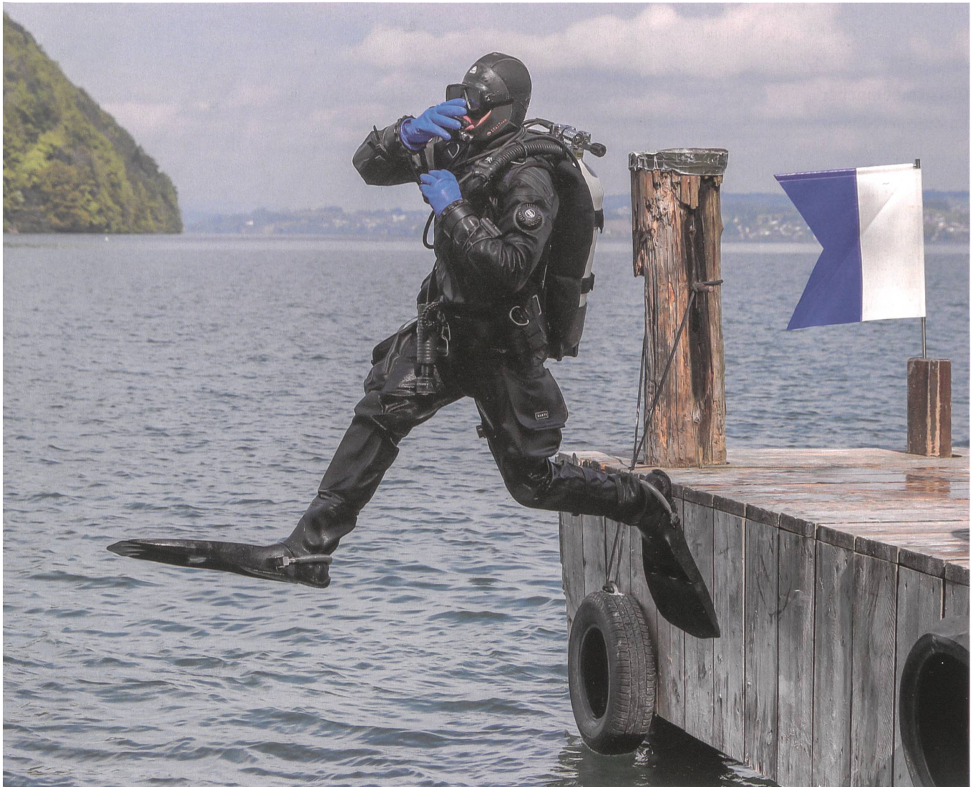
Die blau-weisse Fahne signalisiert den Tauchplatz. Hier in Vitznau (Grundkurs).

Demonstration in Brugg die Ehre. Mit eindrucklichen Aktionen zu Land und zu Wasser demonstrierte der Rekrutenzug seinen Ausbildungsstand und sein Können. Die Medien berichteten in Superlativen über die harten Froschmänner.