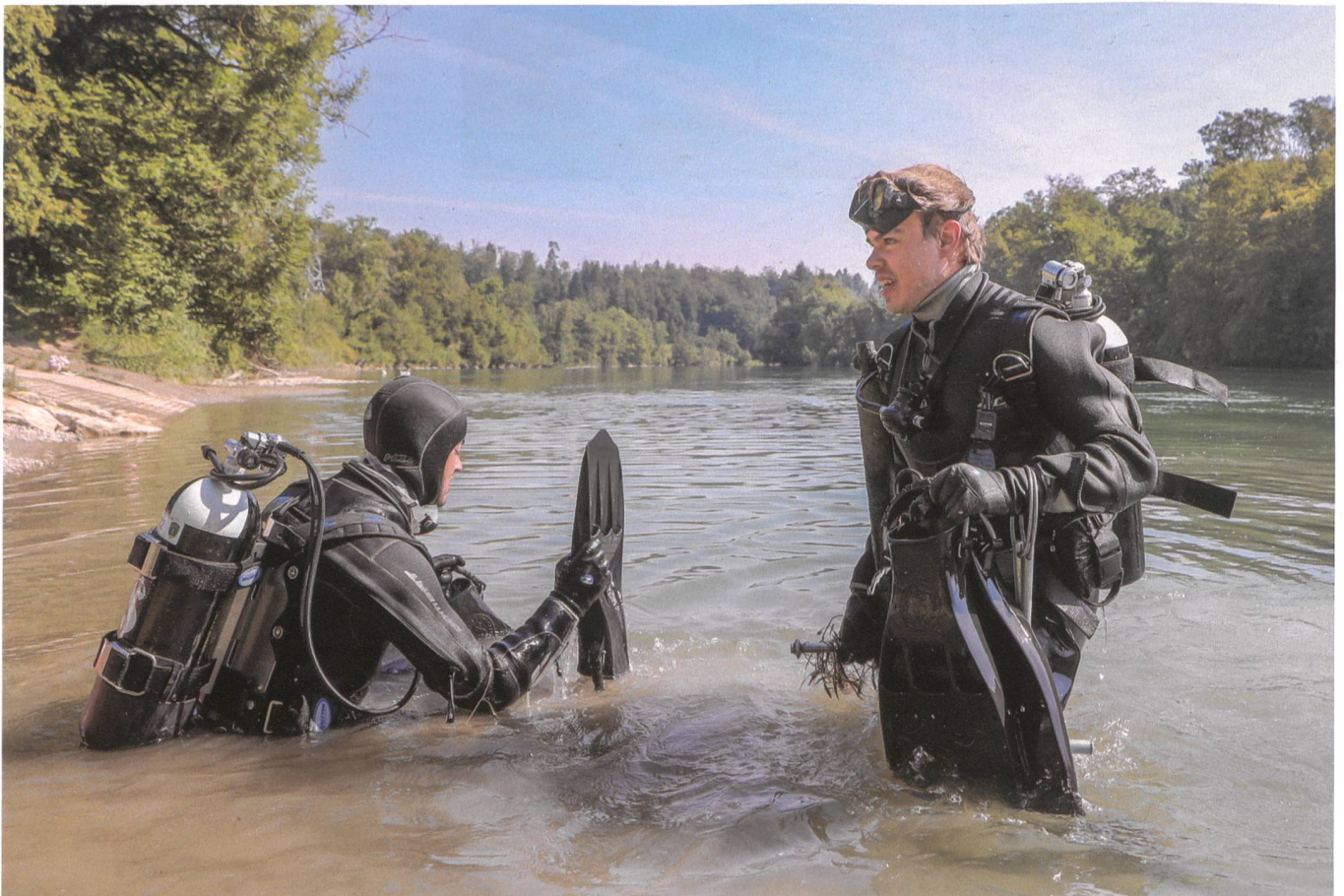
Armeetaucher bergen verloren gegangenes Genie-Material aus der Aare.

Presse, Politik, hohe Offiziere, Attachés anderer Armeen und sogar der US General Westmoreland gaben sich an der