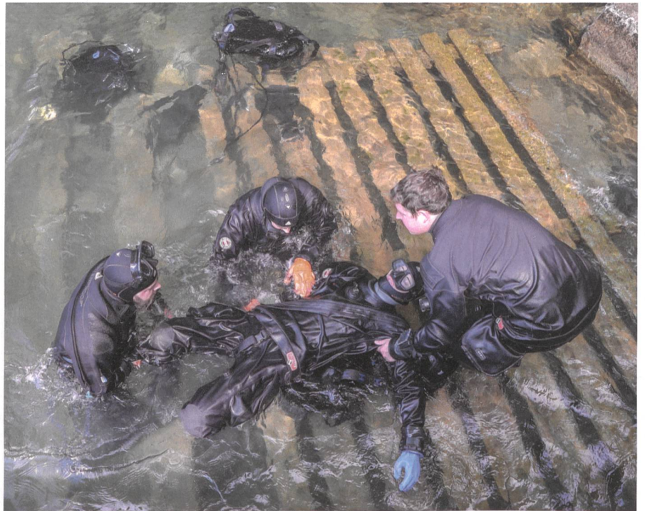
In einer Rettungsübung wird das korrekte Vorgehen bei einem Tauchunfall trainiert.

Jährlich melden sich bis zu 50 Interessenten zu den Armeetauchern.