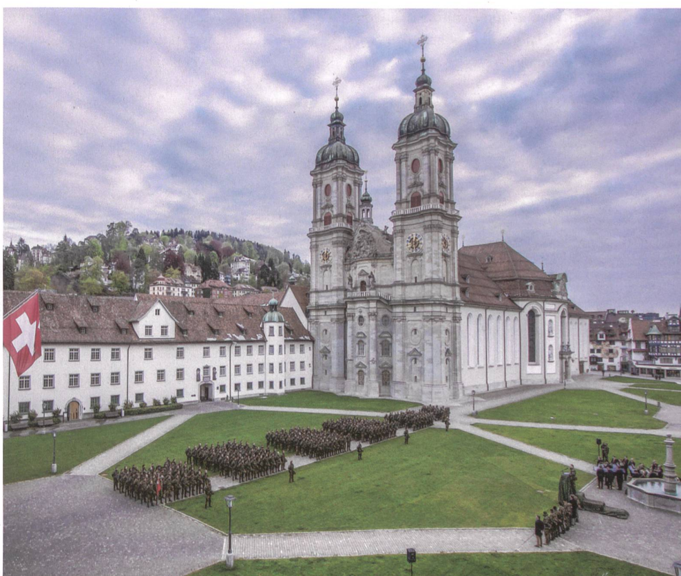
Im Klosterhof von St. Gallen.

Kp Kdt 6/4 Hptm Fabian Wippel, Sachbearbeiter Komp Zen SWISSINT