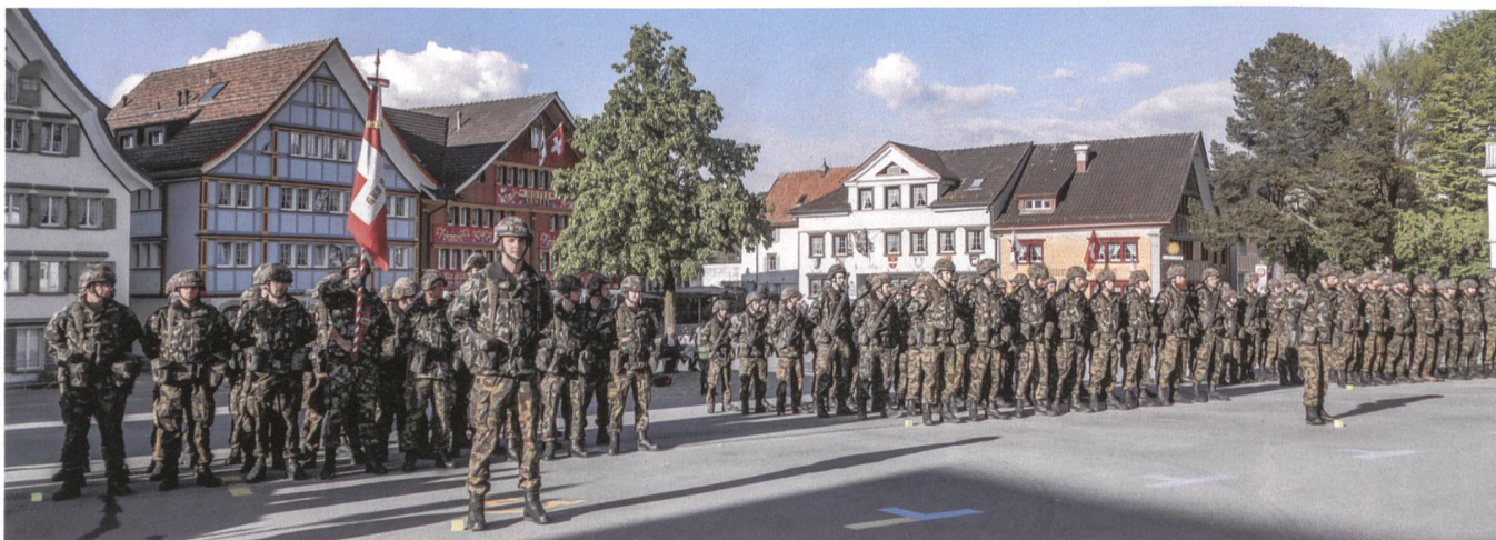
Das Geb S Bat bei der würdigen Fahnenzeremonie.

Eng mit den Schützenverbänden der Westschweiz verbunden, habe er in seiner Militärkarriere oft von den geschichtsträchtigen Zürcher Schützen gehört. Der Chef der Armee zeigte sich sichtlich stolz, dass einige der ältesten Bataillone der