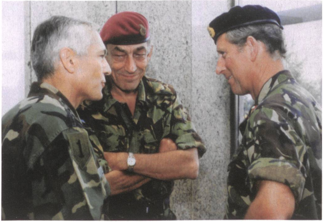
General Wes Clark NATO-Befehlshaber; Generalleutnant Mike Jackson, Kommandant KFOR (mit Prinz Charles).