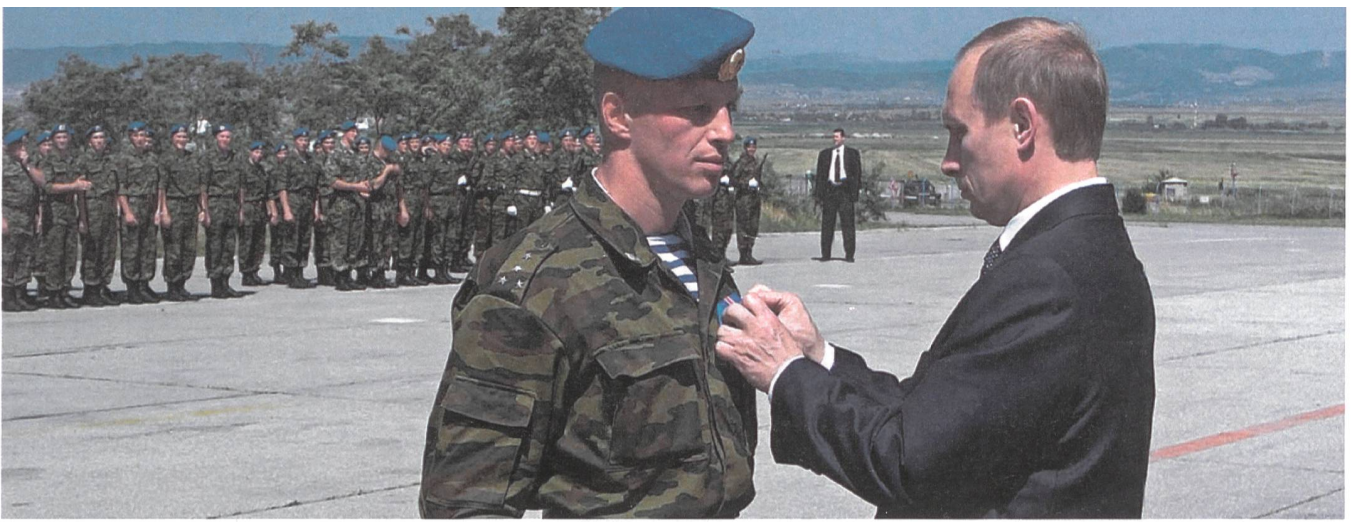
Auf dem Flugplatz verleiht Präsident Putin einem Fallschirmjäger-Hauptmann einen Orden für dessen Kompanie. Wie andere herausragenden Truppen des russischen Heeres trägt der Hauptmann das blau-weiss gestreifte T-Shirt unter der Feldbluse.

nen Vorgesetzten vor den unabsehbaren Konsequenzen, die ein offener Schlagabtausch hatte.