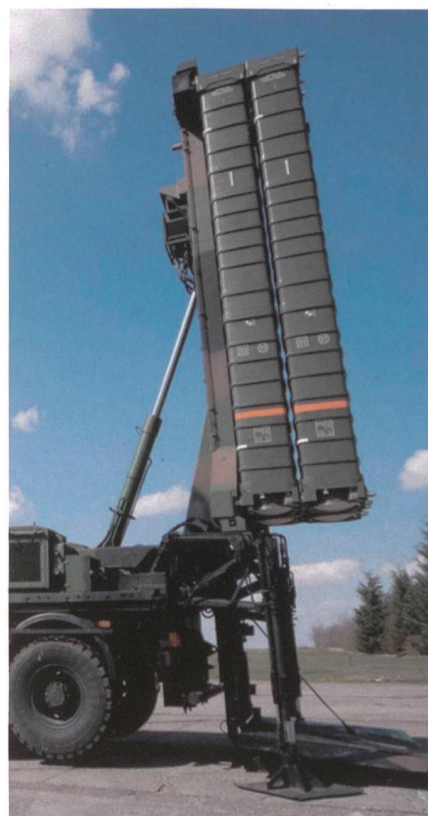
Eurosam führt SAMP/T ins Gefecht.