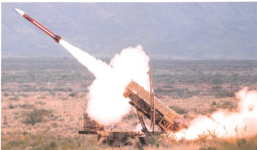
Der amerikanische Grosskonzern Raytheon tritt mit Patriot zur Konkurrenz an.