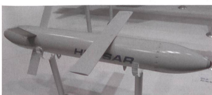
Neue Luft-Boden-Waffe HUSSAR.

Basierend auf aktuellen Einsatzerfahrungen soll das besonders leichte Waffensystem mit der Bezeichnung HUSSAR die Vorteile einer höheren Waffenbeladung mit der Möglichkeit einer präzisen Wirkung gegen zeitkritische Ziele verbinden. Die skalierbare Wirkung des Gefechtskopfs ist für die Bekämpfung von stationären