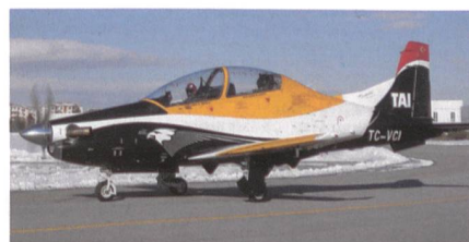
Trainingsflugzeug TAI Hürkus-B.