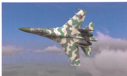
Zusätzliche Su-30KN für Angola.

Die Luftwaffe von Angola hat zwei weitere von den zwölf im Oktober 2013 in Auftrag gegebenen zweisitzigen Mehrzweckkampflugzeugen Suchoi Su-30KN erhalten. Die Auslieferung durch die russische Irkut Corporation sollte ursprünglich ab 2015 erfolgen, sie wurde aber auf das Jahresende 2018 verschoben. Bei den Flugzeugen