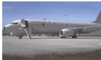
Erste P-8A für die Royal Air Force.

Boeing hat die erste P-8A für die Royal Air Force von Renton zum Boeing Field in