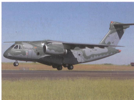
Transportflugzeug KC-390 für Portugal.

Die portugiesische Regierung hat einen Auftrag über fünf Embraer KC-390 Militärtransporter erteilt. Sie sollen die C-130H Hercules ablösen. Angesichts der Verzögerungen werden die ersten Lieferungen an die portugiesischen Luftstreitkräfte nun 2023 erwartet. Die zweistrahligen Transporter gehen an die Esquadra 501 in Montijo. Dort wird auch ein Flugsimulator installiert. Zur Beschaffung gehört