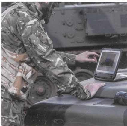
Panasonic: Auftrag von 65 Millionen.

«Als Anbieter von robusten mobilen Endgeräten ist Panasonic seit mehr als 20 Jahren ein zuverlässiger Lieferant von