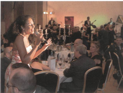
Gute Stimmung im Dominikanerkloster.

Im Jahr 1993 griffen Offiziere beidseits des Rheins die Tradition wieder auf und riefen den neuen Bodensee-Ball ins