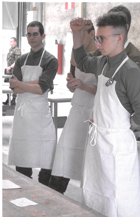
Didaktik wichtige Aspekte.