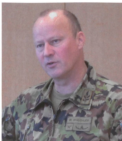
Übungsleiter Divisionär Brülisauer.

Gerade für den jungen Infanteristen sind realitätsnahe Übungen besonders motivierend. In einer Zeit, in der Wiederholungskurse schamlos schlechtgeredet werden, tut eine solche Erfahrung für die Truppe gut. Das Gespräch wird unterbrochen. Ein Transportwagen taucht auf. Bedrohung oder harmloser Alltag? Der Puls steigt. Die Übung ist noch nicht vorbei. ■