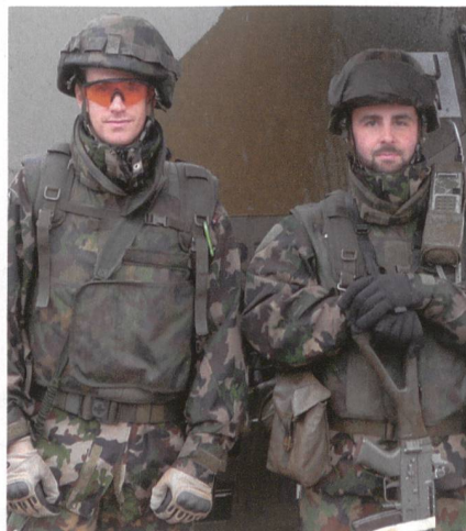
Zwei Kameraden sorgen für Sicherheit.