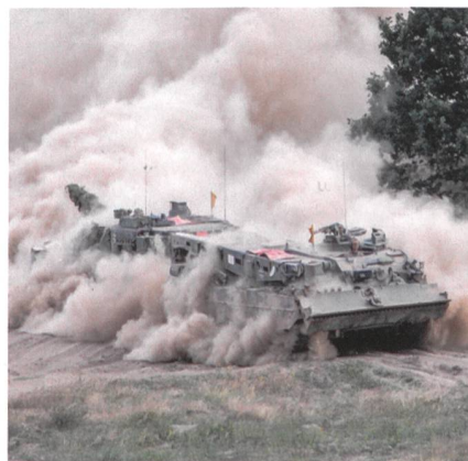
Speerspitze als schnelle Eingreiftruppe: Büffel schleppt Kampfpanzer ab.