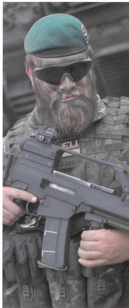
Deutscher Elitekämpfer in Mali.

Für Mazedonien bedeutete der NATO-Gipfel im April 2018 eine Wegmarke. Das Bündnis gelobte, Skopje eine Einladung zu senden, sobald das Land seine Namensänderung hinter sich gebracht hat. Das 30. Mitglied der NATO wäre dann Nordmazedonien.