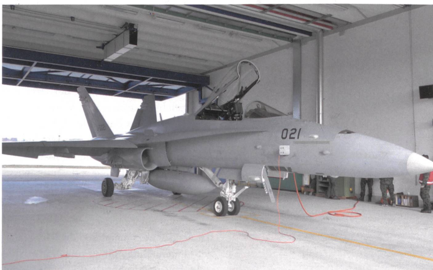
Werden kontrolliert F/A-18 C/D.