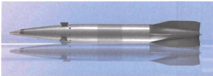
Neue Präzisions-Artilleriemunition VULCANO von Diehl und Leonardo.

Im Auftrag der deutschen und italienischen Regierung haben die Unternehmen Leonardo und Diehl Defence die präzisionsgelenkte Munitionsfamilie Vulcano in den Kalibern 127 mm und 155 mm entwickelt und qualifiziert. Die Vulcano-Munition ist für Reichweiten von 70 km (Vulcano 155) bzw. 80 km (Vulcano 127) ausgelegt und garantiert nach Auskunft der beiden Unter-