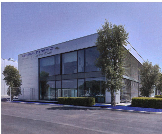
Weltweit bekannt: GDELS-Mowag.

Seit 2003 ist die MOWAG Teil des US-Konzerns General Dynamics: Genauer gesagt Teil der General Dynamics Euro-