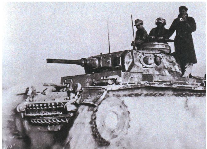
Deutscher Panzer III Ausf. H, 15. Panzer-Division, auf dem Vormarsch Richtung Bir Hacheim, Mai 1942.