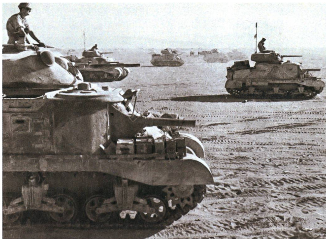
Panzer M3 Grant, 1. Panzer-Division, auf dem Vormarsch Richtung Bir Lefa, Juni 1942.