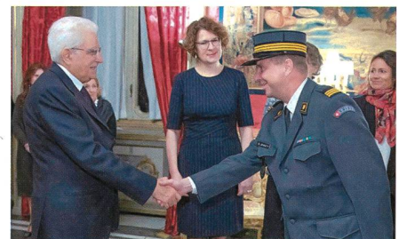
Verteidigungsattachés: Weltweit im Einsatz für die Schweiz