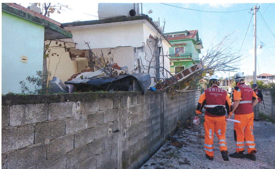
Unübersichtlich – Das Beben hat grosse Schäden angerichtet.

Scholl: Wir hatten ein paar Nachbeben erlebt. Das ist immer ein sehr spezielles Gefühl. Zudem bringen Schadenplätze nach so einer Katastrophe immer Gefahren mit sich. Unsere fundierte Ausbildung in der Armee durch den Lehrverband G/Rttg/