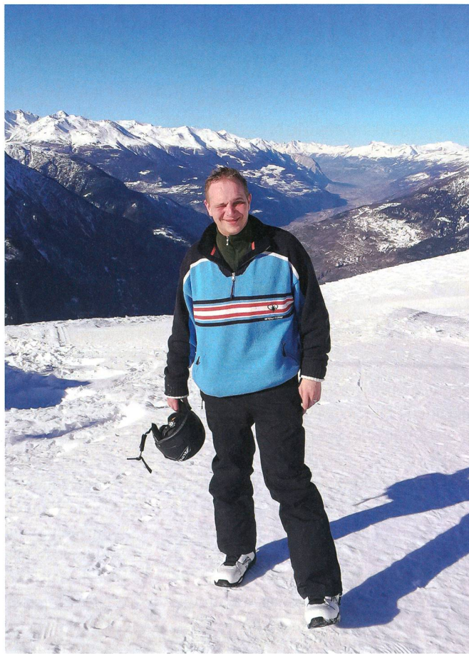
Ein Tag beim Snowboarden im wunderschönen Wallis auf dem Rossberg.

drücken musste erst wieder gelernt werden. Die BUSA machte es uns dahingehend so komfortabel wie möglich. Die Ausbildung wie auch die Ausbildungsthemen waren sehr gut organisiert und auch unsere Lehrer waren methodisch hervorragend geschult.