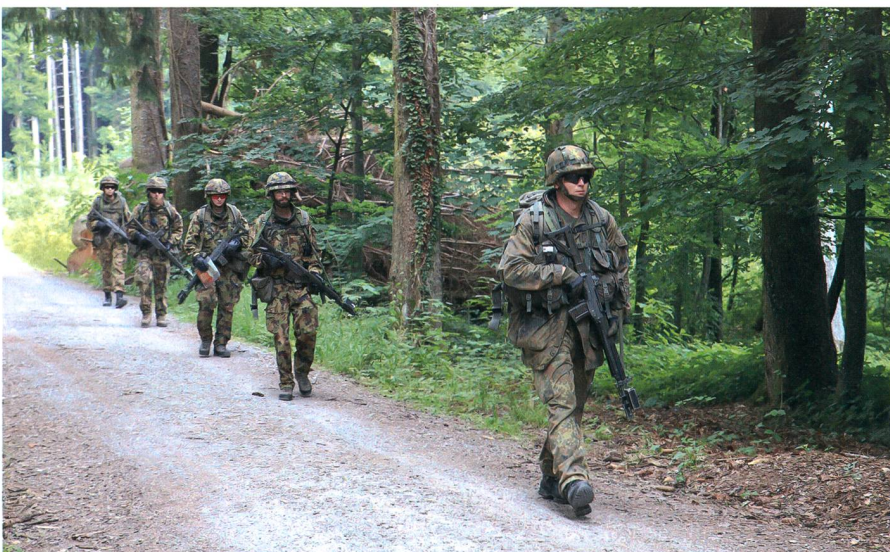
Auf der Verschiebung bei der Übung «DURO».

An der BUSA angekommen, traf mich dann gleich der Schlag. Ich war es bereits gewohnt, mit Abkürzungen und Zahlen zu arbeiten. Jedoch habe ich gemerkt, dass das Militär viel zu viel davon benutzt. Allein die Reglemente und einfachsten Dinge hatten andere Namen, wie z.B. der Rucksack (Packung). Nach einer kurzen Eingewöhnung war aber auch das nur noch selten ein Problem. Viel mehr hatte ich Mühe mit den Theorieeinheiten, die in der Anfangszeit eine hohe Frequenz hatten, zurechtzukommen. Die Schulbank