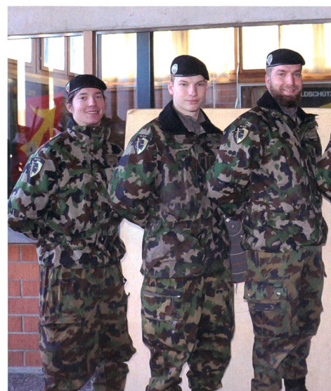
Der Zug BIVIO (Pz Kp 21/2) ist bereit.