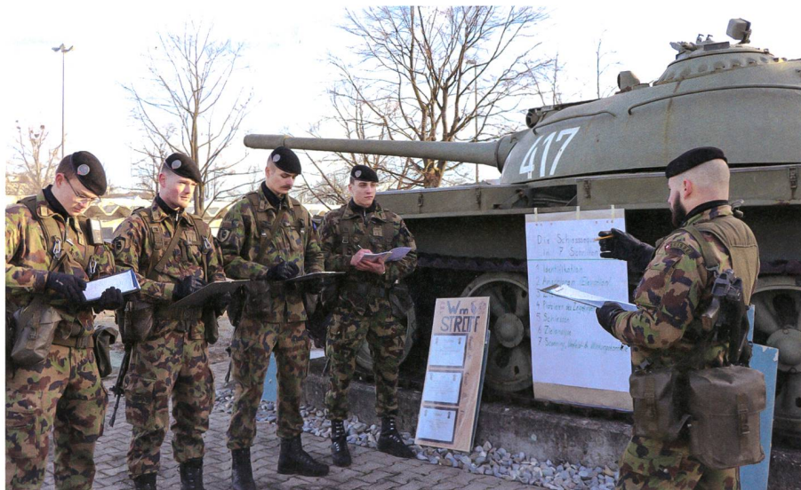
Zugführer gibt am Ausbildungsrapport Feedback an seine Gruppenführer.

Praktischen Dienst sind 19 und 20 Jahre alt. Hoffmann absolvierte das Gymnasium während Ueltschi eine Lehre als Polymechaniker abschloss. Als wir die Unteroffiziere zum Gespräch trafen, waren sie noch in den Vorbereitungen für den Start der