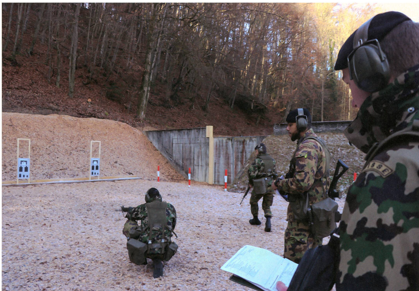
Praktische Schiessausbildung der Gruppenführer – überwacht durch den Zugführer.