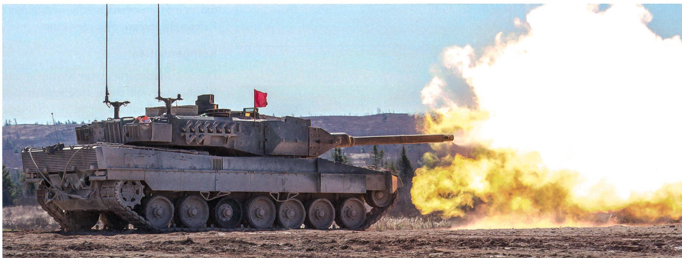
100 Jahre Panzerentwicklung – Darunter auch die Geschichte des M1 Abrams.