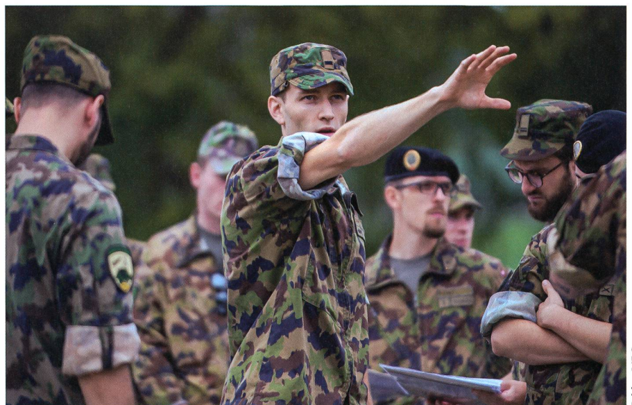
Mit Vorbild führen!