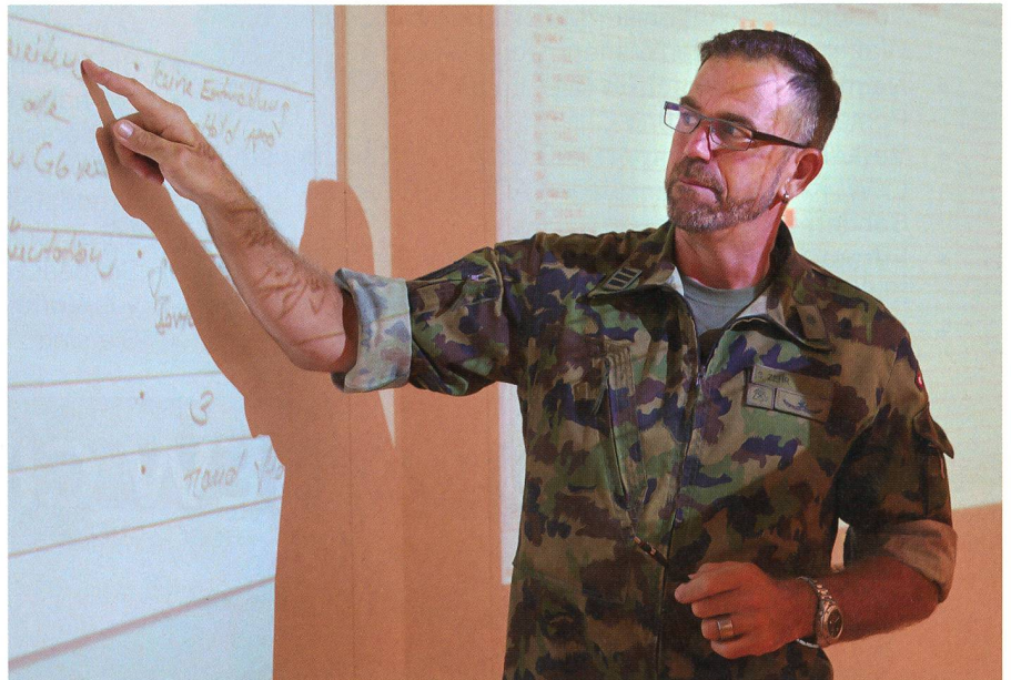
Es gilt: als Vorbild Ruhe zu bewahren und überzeugend zu führen.

Unsere Landesregierung leistet vorzügliche Arbeit! Sie führt unser Land mit Umsicht, und es ist an uns, dies mit korrektem Verhalten zu würdigen. Der Bundesrat hat in unserem Interesse diese Anordnungen getroffen, damit wir sie einhalten, auch