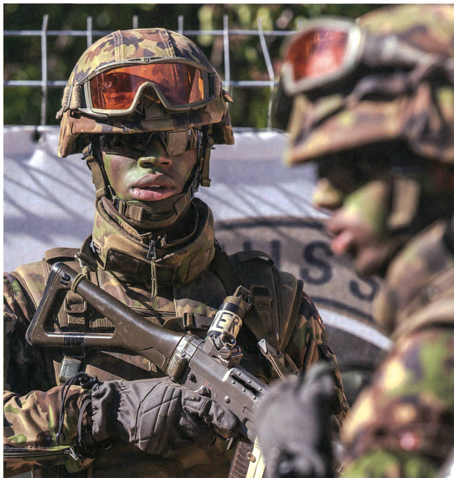
In jedem Fall wirken Vorbilder: Ein Soldat hört seinem Gruppenführer bei der Befehlsausgabe zu.